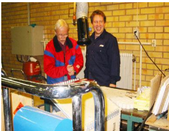
Uno studente e il suo facilitatore in una delle società di Karlskoga, Svezia