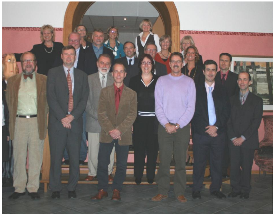
Gli orgogliosi partner del progetto EUExcert

In questa prima newsletter vi presentiamo i vari partner del progetto.