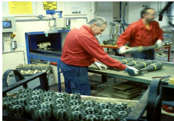
educazione e lavoro nel settore esplosivo sono di gran interesse nel progetto